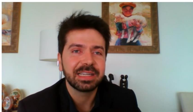
Evento de Lançamento Consulta Pública dos Atributos

Os atributos têm a finalidade de melhorar a identificação das mercadorias e conferir mais segurança jurídica e previsibilidade tanto aos operadores de comércio exterior quanto aos órgãos de controle aduaneiro e demais agências de fronteira, elevando a qualidade da gestão de riscos nas variadas rotinas de anuências e de fiscalização, além de viabilizar análises mais robustas de dados estatísticos para a construção de políticas públicas mais detalhadas. A base de dados dos atributos foi construída no âmbito do Projeto Mapeamento e Definição dos Atributos do Programa Portal Único de Comércio Exterior a partir de sugestões de representantes de 43 setores da economia e dos órgãos intervenientes no comércio exterior.